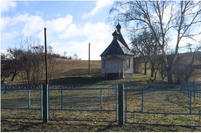
Kostel postavený roku 2024.