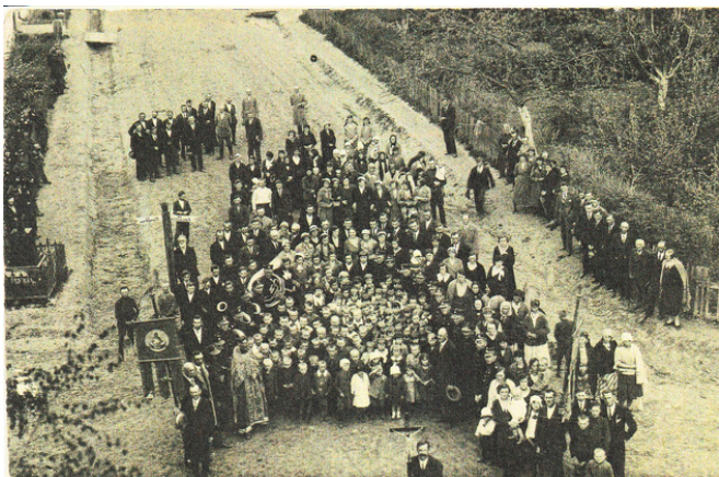
Církevní slavnost (provody) asi v roce 1934.