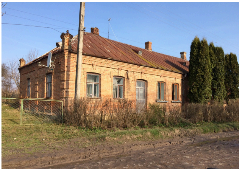
Dům Libovických v roce 2020.